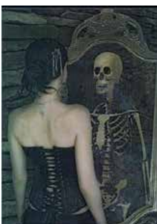
Рис. 4. Моє минуле