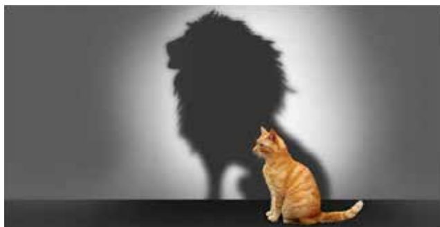
Рис. 3. Як я бачу себе (лев)