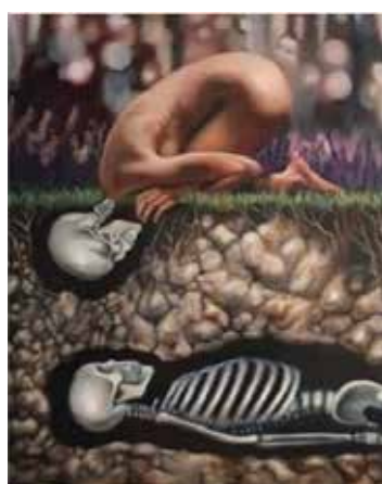
Рис. 5. Спілкування з дідусем

Психомалюнок в АСПП використовується як форма самопрезентації його учасників. Проходження груп АСПП відкриває перспективи адекватного самопізнання особою власної психіки через активізацію механізму партиципації (співпричетності). Вказаний механізм закладено у психіці ще із часів домовного періоду розвитку людства, коли принцип реальності ігнорувалася. Об'єктивування інформації здійснювалось через співпричетність предметів (тобто через механізм партиципації). Вказаний механізм емпірично підтверджується семантичною полізначністю тематичних психомалюнків за наявності взаємозв'язку в їх упорядкуванні особою, згідно зі значущістю. Зокрема, використання багатьма людьми того самого психомалюнка (у різних поєднаннях з іншими малюнками) засвідчує індивідуалізацію змісту психіки конкретної людини. Сказане вище аргументує відмінність психодинамічного підходу в її цілісності («свідоме / несвідоме») до розуміння психіки від академічного його трактування.