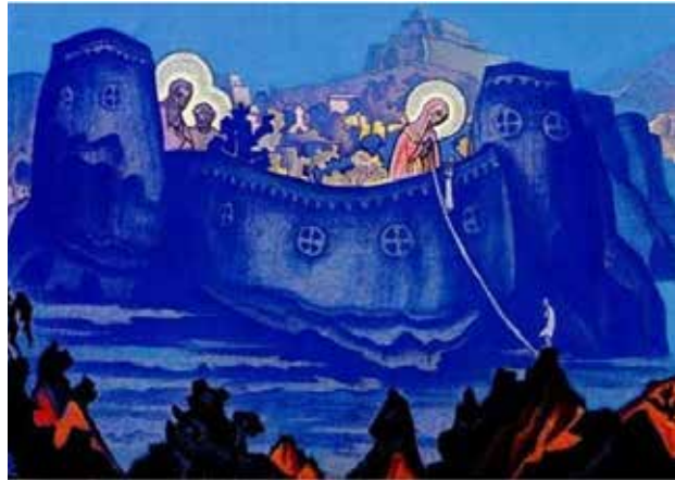
Рис. 1. М. Реріх. «Мадонна Лаборіс»

до статті «Актуалізація прагматичного мислення в учасників глибинного пізнання». Стенограма психоаналітичної роботи з респондентом Я. на прикладі репродукції художнього полотна М. Реріха «Мадонна Лаборіс»