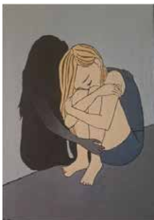
Рис. 2. Моя істинність у тіні