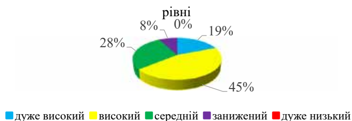
Рис. 1. Результати дослідження емпатійних тенденцій за методикою В. Бойко, у %

Було виявлено, що кількість респондентів, які мають дуже високий рівень емпатії, становить 13%, високий рівень емпатії мають 74% учителів, нормальний рівень – 13%. Низький і дуже низький рівень емпатії серед даної вибірки респондентів не виявлено. Такі результати можуть вказувати на те, що вчителі працюють в умовах війни не перший рік, тому «м'якше» сприймають негативний психологічний вплив, що спричиняє війна, тобто в них виникла адаптація до цього впливу. На нашу думку, такий рівень емпатії є оптимальним для професійної діяльності вчителя.