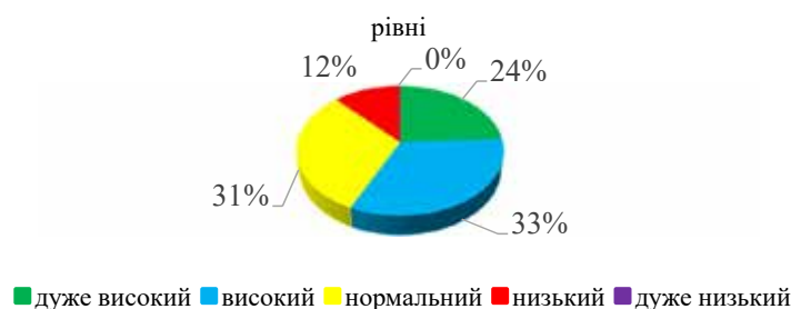
Рис. 2. Результати дослідження рівнів емпатії за методикою «Дослідження емпатійних тенденцій» І. Юсупова, %