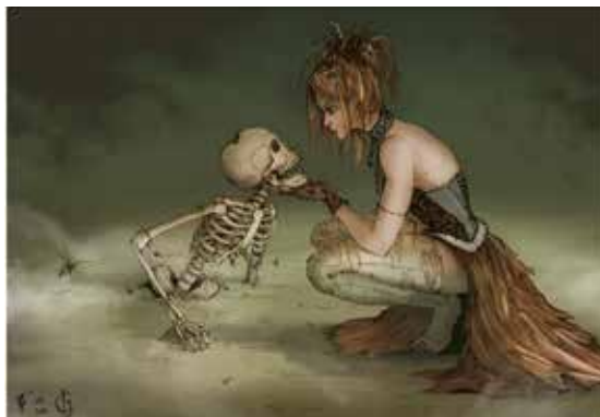
Рис. 2. Драматична подія мого життя