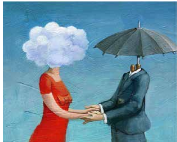
Рис. 13. Мій партнер по спілкуванню

АСПП дає змогу кожній людині бути собою та робити власні висновки. Велику значущість у цих процесах має процесуальна діагностика, яка сприяє визначенню корекційних потреб внесення суб'єктом особистісних змін.