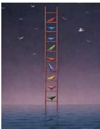
Рис. 8. Мої можливості, мої бажання

З огляду на сказане стає зрозумілим, чому діагностико-корекційний процес у групах АСПП проходить на засадах спонтанності поведінки, безоцінності суджень, на тлі взаємоприйняття учасниками пізнання «кожний кожного» (і себе самого). Гуманістичне тло групових занять