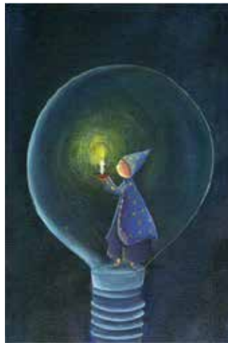
Рис. 12. Самотність