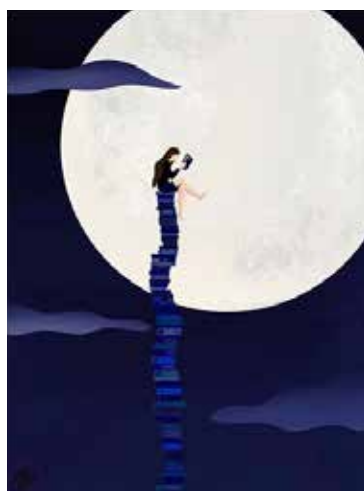
Рис. 9. Мій звичайний емоційний стан