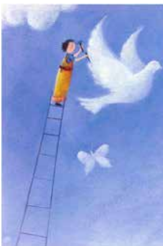
Рис. 4. Як я бачу себе