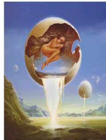
Рис. 6. Я-реальна, Я-ідеальна