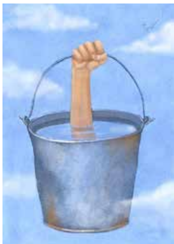
Рис. 1. Мій звичайний емоційний стан

Основною характеристикою активності «Зверх-Ід» є ігнорування «принципу реальності». Аналіз підструктур, які презентує «Модель» (рис. 7), вказує на взаємозв'язок за вищевказаною ознакою ігнорування «принципу реальності» – «Зверх-Ід» з іншою підструктурою психіки за показ-