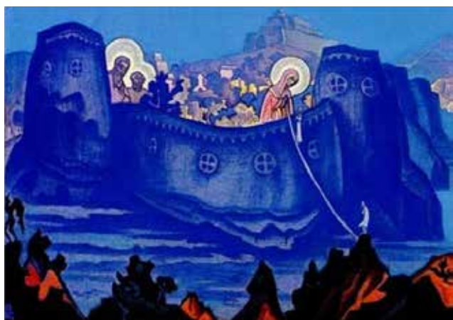
Рис. 14. М. Періх. «Мадонна Лаборіс»

Стенографічний матеріал реалізації методу АСПП доводить, що глибинне пізнання психіки