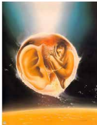
Рис. 5. Що було до мого народження