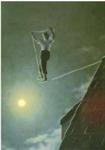
Рис. 11. Я йду назустріч біді