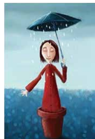
Рис. 10. Я в сім'ї батьків