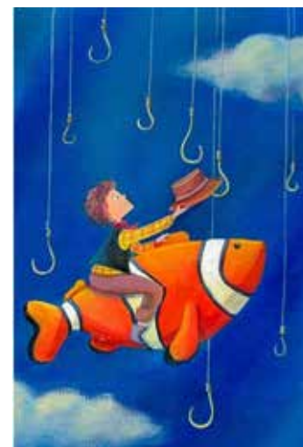
Рис. 3. Мої бажання, мої можливості