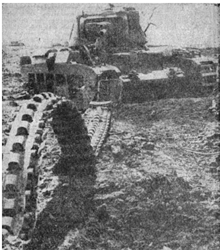
Рис. 5. Фото з газети Deutsche Ukraine-Zeitung. 1942. № 111. 31 Mai, S. 1

відному коментарі було сказано (перекл. з нім. – Авт. ): «Серед гігантських танків, розміщених советами в районі Харкова, було багато американських, з допомогою яких Рузвельт хотів долучитися до успіху Тимошенка» 44 .