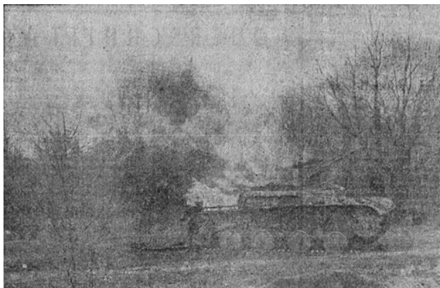
Рис. 1. Фото з газету Deutsche Ukraine-Zeitung. 1942. № 107. 27 Mai, S. 1

Deutsche Ukraine-Zeitung 30 травня вмістила повідомлення з Берліна від 29 травня Moskau verschweigt Niederlage von Charkow («Москва приховує поразку в Харкові»). Наголошено, що коли німецьке командування сповіщало про переможне закінчення бою, радянська сторона обмежилася запевненнями, що в районі Ізюм – Барвенково запеклі піхотні й танкові атаки німців були відбиті, та нічого іншого суттєвого не сталося. У жодній формі й жодним словом не згадується про бойові дії, які мали серйозні наслідки для совєтів 24 .