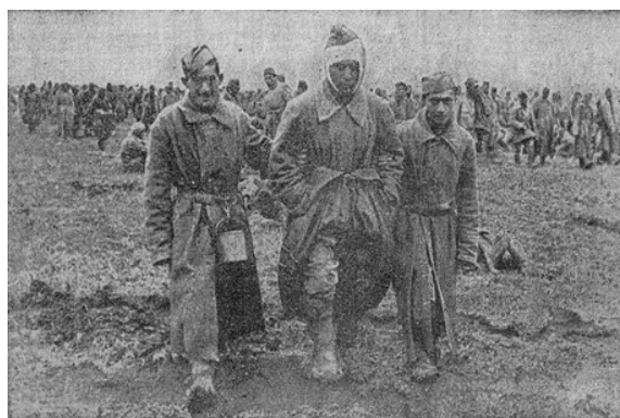
Рис. 2. Фото із газету Deutsche Ukraine-Zeitung. 1942. № 110. 30 Mai, S. 1

Газета «Нове українське слово» 31 травня надрукувала спеціальне зведення верховного командування німецьких збройних сил від 30 травня про те, що «великий бій під Харковом скінчився» 26 . Повідомлялося, що 6-та, 9-та і 57-а радянські армії, які налічували разом близько 20 стрілецьких дивізій, 7 кавалерійських дивізій та 14 танкових бригад, знищені. Кількість полонених сягає 240 тис осіб. Криваві втрати противника надзвичайно великі. Кількість здобутого та знищеного військового спорядження доходить до 1 249 танків, 2 065 гармат, 538 літаків та величезної кількості іншої зброї та спорядження 27 .