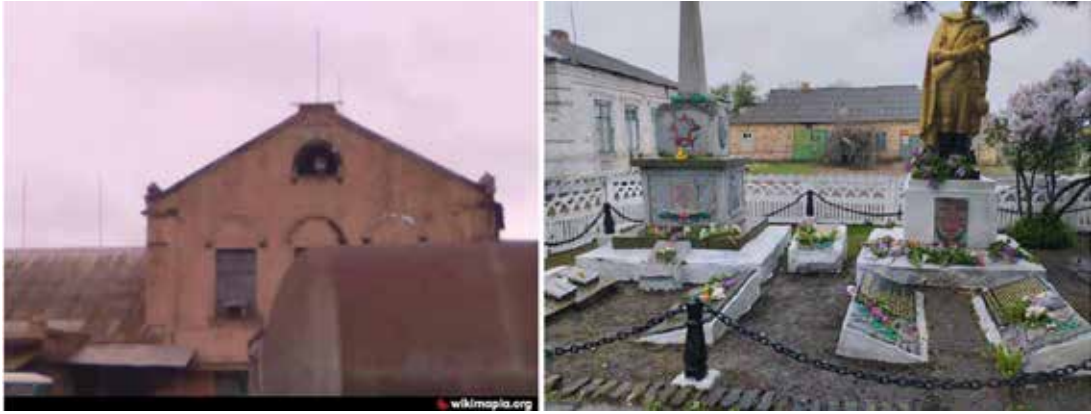
Рис. 2. Пам'ятки Бойківської громади Кальміуського району, візуальні зображення яких були знайдені виключно на ресурсі Вікітарія та неназваному ЗМІ т.зв. «ДНР»: руїни Молочного заводу у Бойківському та невідомий будинок початку ХХ ст. у Греково-Олександрівці