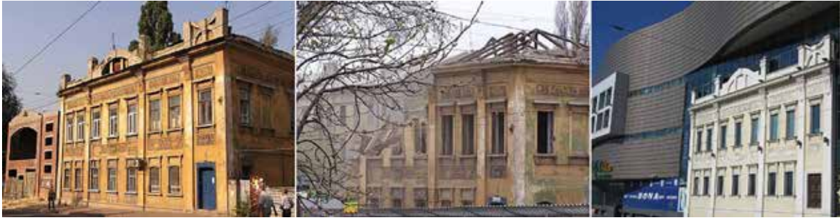
Рис. 1. Приклад «реконструкції» – знищення купецького будинку на Постишева, 44, м. Донецьк

графічними картами та діловодною документацією органів державної влади 6 , що дозволило уточнити локалізацію, реконструювати особливості функціонування пам'яток у різні історичні періоди, між різними культурними контекстами: наприклад, за часів міграції німецьких і бойківських/лемківських переселенців у Бойківській громаді (Mieliekiestsev K., 2025).