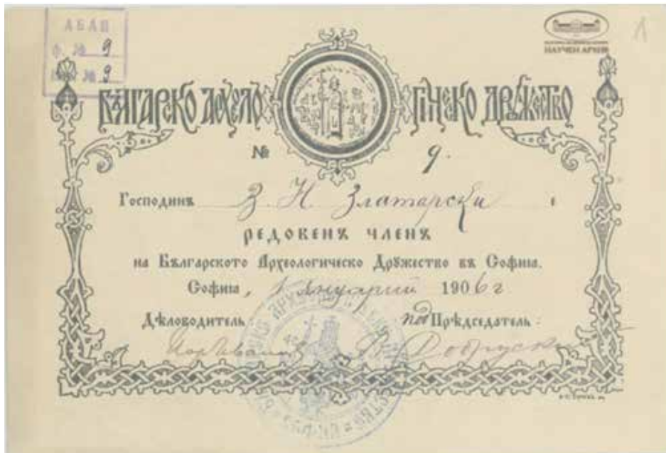
Рис. 2. Членський квиток В. Златарського 8

Васил Златарський, враховуючи здобуті знання та досвід, долучався до всіх наукових та громадських процесів Болгарії. Він був серед тих науковців, які стояли біля витоків болгарської археології (Арсенова И., 2008, с. 6). У 1897 р. вчений провів перші розкопки в Преславі (Златарска-Тодорова К., 1975, с. 33). У 1899–1900 рр. взяв участь у розкопках Абаби, саме під час цієї експедиції було відкрито стародавню болгарську столицю – Плиску 6 (Недков С., 2006, с. 107). У 1901 р. було створено Болгарське археологічне товариство, членом якого став В. Златарський 7 . Пізніше товариство було перетворено на Болгарський археологічний інститут, отримавши статус окремої самостійної установи, до ради якої входив вчений (Стаменова М., 2012, с. 156; 167).